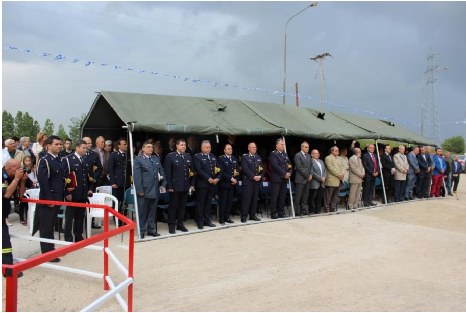
Εικόνα 7 27-5-2017 Εγκαίνια της νέας υπηρεσίας. ΜΆΛΛΟΝ ΌΛΟΙ ΑΥΤΟΙ ΜΑΖΈΥΤΗΚΑΝ ΓΙΑ ΝΑ ΕΓΚΑΙΝΙΑΣΟΥΝ ΕΝΑ ΚΟΤΈΤΣΙ

Δείτε τώρα πως έχουν τα πράγματα . στις 30-1-2021 με ΑΔΑ ΨΨΝΩΨΟ-ΠΨΙ γίνεται ανάθεση 29.844,00 ευρώ για την δημιουργία στεγασμένου χώρου για τα οχήματα του Κλιμακίου και όχι για την διαμόρφωση του χώρου αναμονής και ανάπαυσης του προσωπικού.