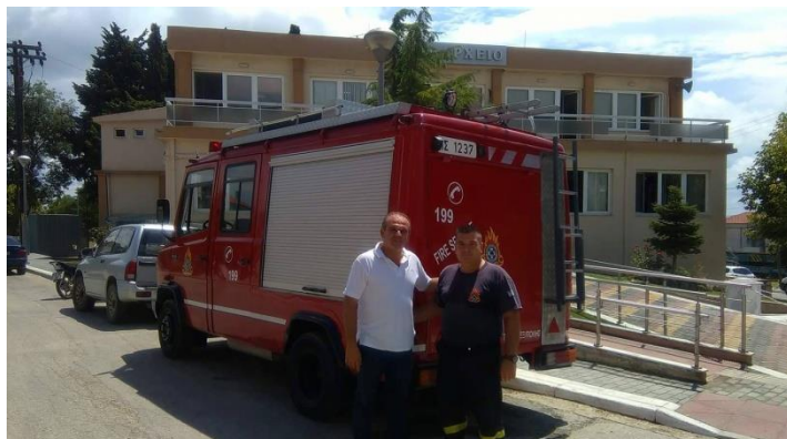
Εικόνα 5 28-7-2017 Η άφιξη του νέου οχήματος για φωτιές αστικού περιβάλλοντος .

Παράλληλα το Κλιμάκιο έπρεπε να εφοδιαστεί και με δεύτερο όχημα . Βρέθηκε ανακατασκευάστηκε από την Π.Υ και του προσθέσαμε και εξοπλισμό.