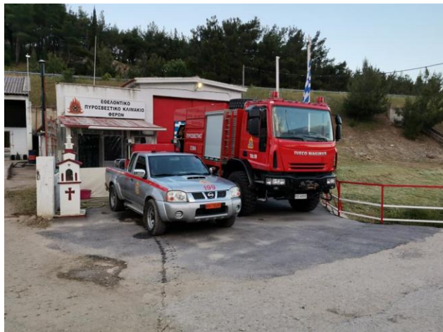
Εικόνα 6 2-6-2021 Η έλευση του ΙΒΕΚΟ 4 τόνων .