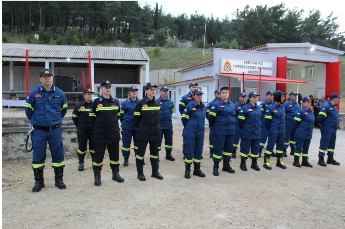
Εικόνα 4 27-5-2017 Τα εγκαινία με τους εθελοντές μας

Παράλληλα το Κλιμάκιο έπρεπε να εφοδιαστεί και με δεύτερο όχημα . Βρέθηκε ανακατασκευάστηκε από την Π.Υ και του προσθέσαμε και εξοπλισμό.