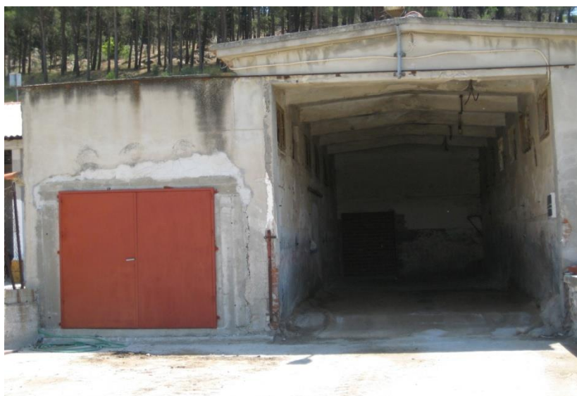
Εικόνα 1 13-7-2011