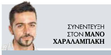
ΣΥΝΕΝΤΕΥΞΗ ΣΤΟΝ ΜΑΝΟ ΧΑΡΑΛΑΜΠΙΑΚΗ

«Οι νέοι της Πατρίδος μας σήμερα βιώνουν απορία και φόβο. Απορούν για το παρόν και φοβούνται το μέλλον. Την Εκκλησία δεν τη γνωρίζουν αλλά θα ήθελαν πολύ να την εμπιστευθούν» λέει στα «ΝΕΑ Σαββατοκύριακο» ο μητροπολίτης που ήταν από τους πρώτους που μίλησαν για τη σημασία των εμβολιασμών