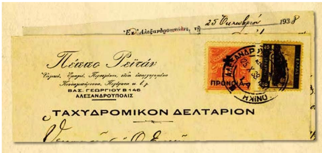
Εικόνα 4: 25 Οκτωβρίου 1938, ταχυδρομικό δελτάριο με τη σφραγίδα του κ. Πέππο Ρεϊτάν.

Στις αρχές της τραγικής δεκαετίας του 1940 , οι Εβραίοι της Αλεξανδρούπολης ήταν περίπου 150 . Μαζί με τους ομοθρήσκους τους όλων των περιοχών της Θράκης και της Ανατολικής Μακεδονίας, συνελήφθησαν το βράδυ της 3ης Μαρτίου 1943 από τις Γερμανο-Βουλγαρικές Αρχές Κατοχής και στάλθηκαν στα ναζιστικά στρατόπεδα του θανάτου.