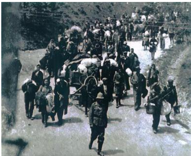
Εικόνα 5: Μάρτιος 1943. Ξεκινάει η εκτόπιση των Εβραίων από το Διδυμότειχο

Στις αρχές της τραγικής δεκαετίας του 1940 , οι Εβραίοι της Αλεξανδρούπολης ήταν περίπου 150 . Μαζί με τους ομοθρήσκους τους όλων των περιοχών της Θράκης και της Ανατολικής Μακεδονίας, συνελήφθησαν το βράδυ της 3ης Μαρτίου 1943 από τις Γερμανο-Βουλγαρικές Αρχές Κατοχής και στάλθηκαν στα ναζιστικά στρατόπεδα του θανάτου.