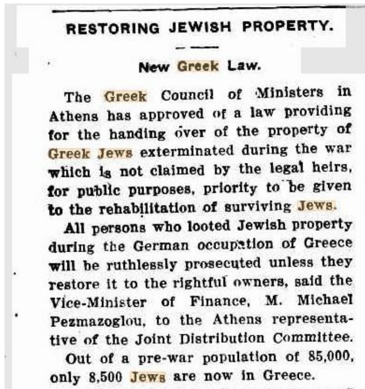
Εικόνα 7: 15 Νοεμβρίου 1945, στην εφημερίδα "The Hebrew Standard" της Αυστραλίας υπάρχει άρθρο με τίτλο "Restoring Jewish Property" και αναφέρεται στο νέο νόμο του Ελληνικού κράτους.

Ευχόμαστε με όλη μας την ψυχή και δυνατή φωνή ΠΟΤΕ ΞΑΝΑ! Η Διεθνής Ημέρα Μνήμης των Θυμάτων του Ολοκαυτώματος είναι η ημέρα που μας θυμίζει και ενισχύει την υποχρέωση μας απέναντι στα ανθρώπινα δικαιώματα όλο το χρόνο! Πρέπει να εξασφαλίσουμε ότι οι νέες γενιές γνωρίζουν αυτή την ιστορία και δεν θα επαναληφθεί ποτέ.