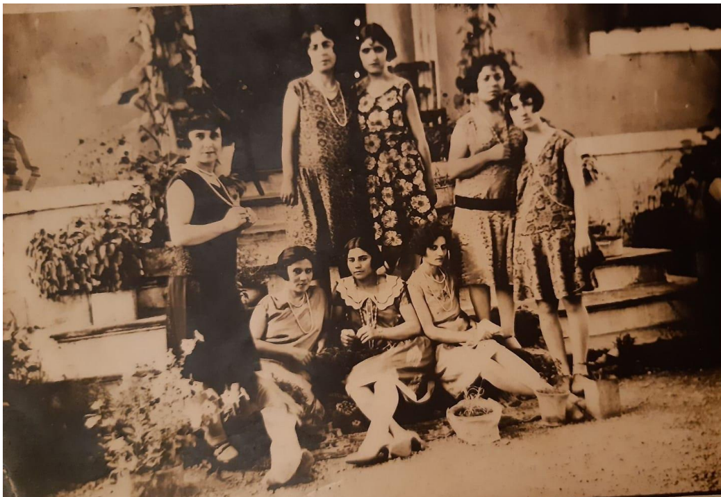
Εικόνα 1: 1925, μπροστά στη Συναγωγή της Αλεξανδρούπολης φωτογραφίζονται νεαρές κυρίες της Εβραϊκής και της Αρμένικης κοινότητας.

Ο Σιδηρόδρομος και το Λιμάνι χάραξαν την ιστορία της Αλεξανδρούπολης και δημιούργησαν μια πόλη νέα και κοσμοπολίτισσα με διεθνείς τράπεζες, προξενεία και εμπορικούς ακολούθους ξένων χωρών. Ανάμεσα στους πληθυσμούς που μετακινήθηκαν στη νέα πόλη για εργασία και καλύτερο μέλλον ήταν και Εβραϊκής καταγωγής όπως φαίνεται στις απογραφές. Το 1889 ήταν 35 άτομα ενώ το 1928 κατοικούσαν 181 συμπολίτες μας Εβραϊκής καταγωγής, όπως καταγράφει ο ιστορικός ερευνητής κύριος Θρασύβουλος Παπαστρατής .