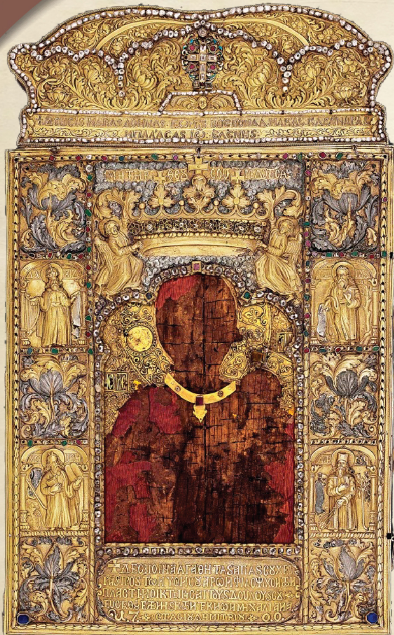
Η ΘΑΥΜΑΤΟΥΡΓΟΣ ΕΙΚΟΝΑ ΤΗΣ ΠΑΝΑΓΙΑΣ ΣΟΥΜΕΛΑ