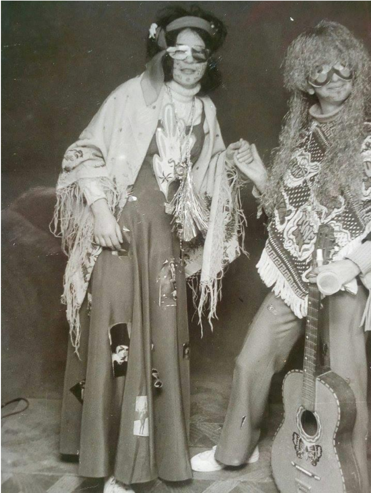
Εικόνα 39: 28 Φεβρουαρίου 1972, Καρναβαλίστριες στην Αλεξανδρούπολη

Σήμερα οι Απόκριες ονομάζονται « Τριώδιο ». Η ονομασία αυτή προέρχεται από τις «τρεις ωδές» του Ευαγγελίου της Ορθοδοξίας. Το « Τριώδιο » αρχίζει την Κυριακή του «Τελώνη και Φαρισαίου», συνεχίζει με την Κυριακή του «Ασώτου Υιού», την Κυριακή της «Απόκρεω» και ολοκληρώνεται την Κυριακή της «Τυρινής» ή «Τυροφάγου». Η επόμενη είναι η πρώτη μέρα της Σαρακοστής και της νηστείας, η οποία διαρκεί 40 ημέρες. Οι χριστιανοί ονόμασαν την μέρα αυτή « Καθαρά Δευτέρα », γιατί με την έναρξη της νηστείας ξεκινάει η «κάθαρση» του σώματος και του πνεύματος.