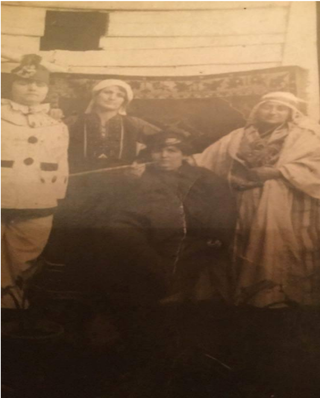
Εικόνα 4: 1916 Καρναβάλια στην Αλεξανδρούπολη ακριβώς ένα αιώνα πριν! Απεικονίζονται οι συνήθειες και ενδυμασίες που επέλεξαν για να γιορτάσουν αυτό το πανάρχαιο έθιμο στον Έβρο των αρχών του 20ου αιώνα.

Εκτός από το πολύ γνωστό καρναβάλι της Ξάνθης , παραδόσεις αποκριάτικες έχουν μείνει ζωντανές σε όλη τη Θράκη. Στον Έβρο συγκεκριμένα, το έθιμο της Καμήλας αναβιώνει κάθε χρόνο την Καθαρά Δευτέρα στις Φέρες , την κωμόπολη του Έβρου!