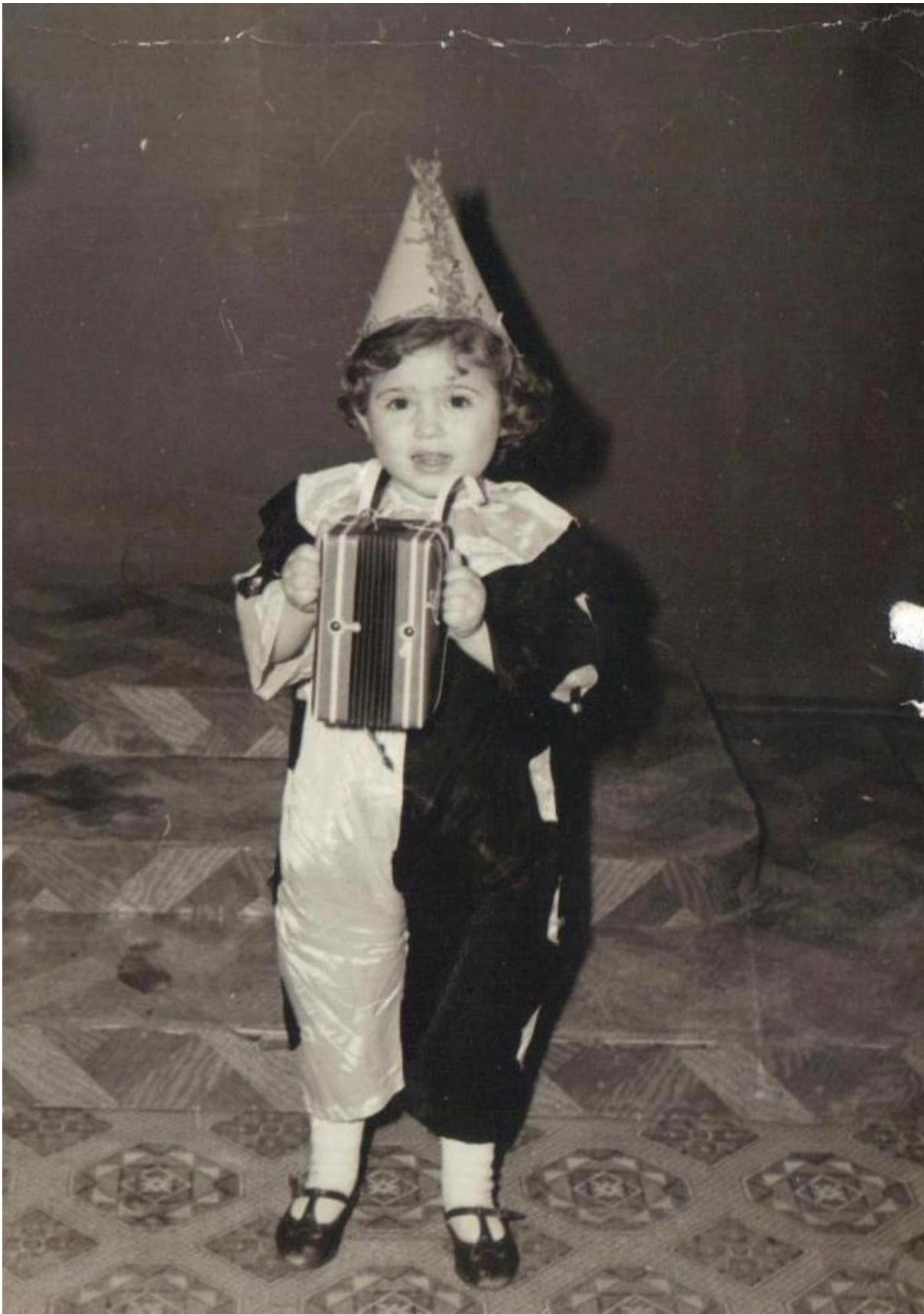
Εικόνα 19: 1960 Ένας μικρός Πιερότος στην Αλεξανδρούπολη!