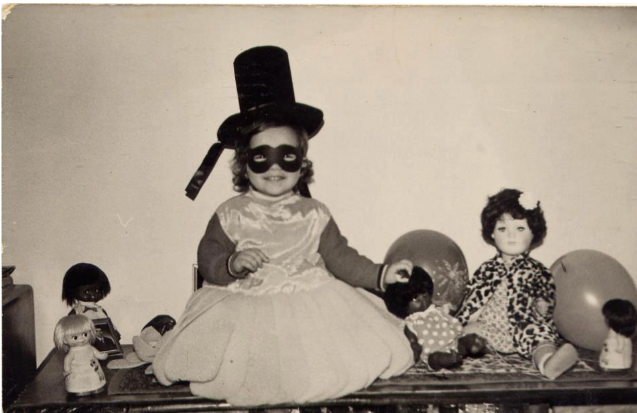
Εικόνα 35: 28 Φεβρουαρίου 1971, μικρή καρναβαλίστρια στην Αλεξανδρούπολη ένα με τις κούκλες της!