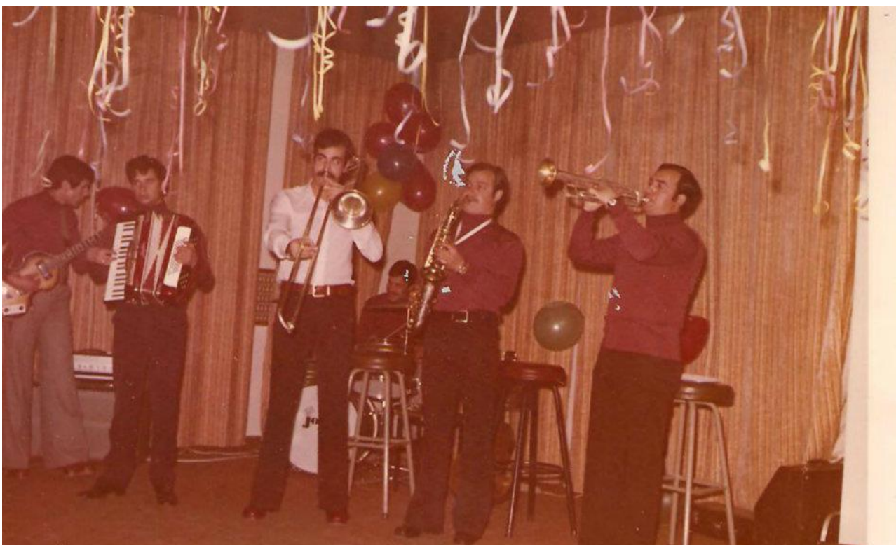
Εικόνα 36: 1972 - Η ορχήστρα της Στρατιωτικής Μουσικής σε αποκριάτικο χορό στη Λέσχη Αξιωματικών Αλεξανδρούπολης