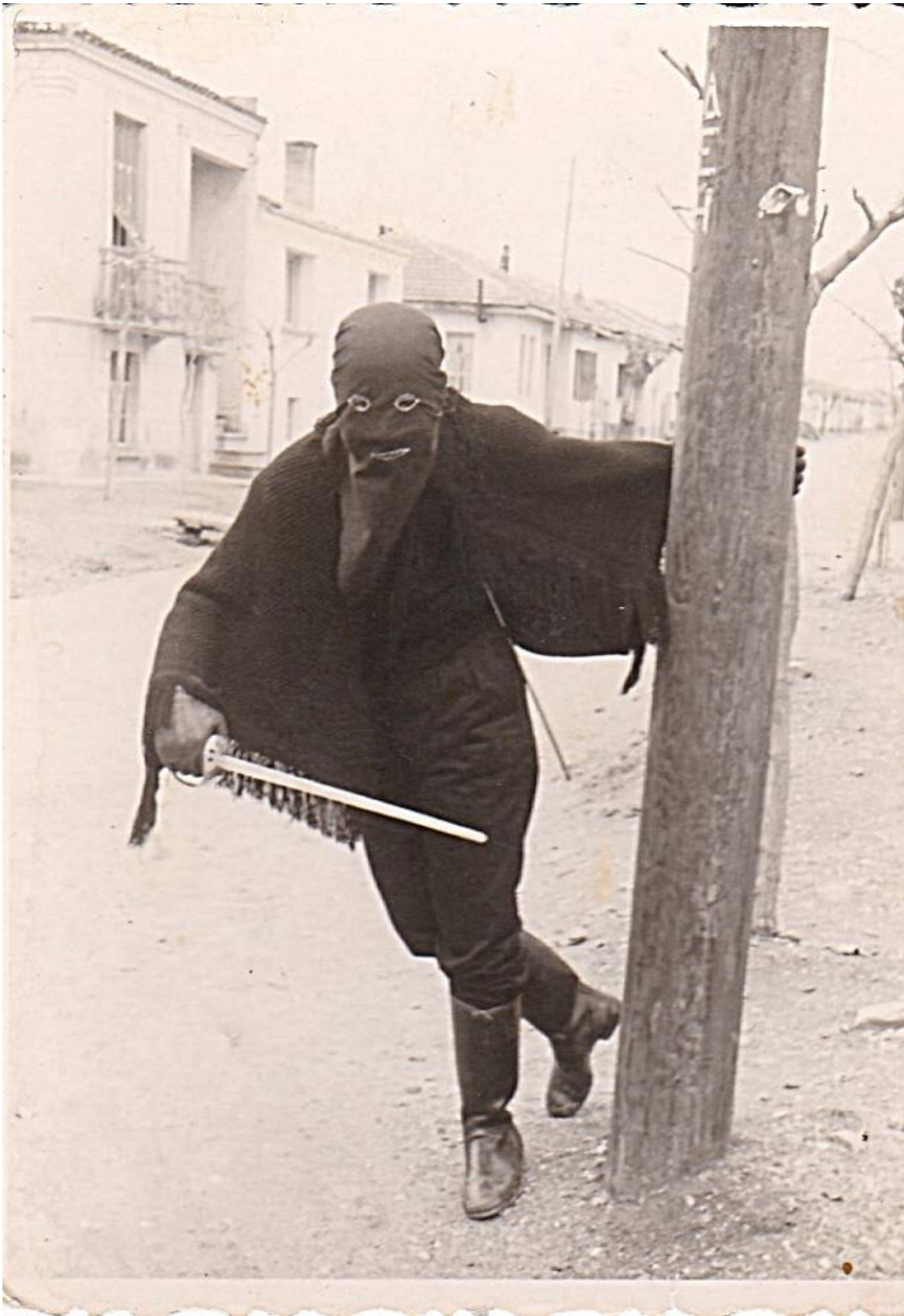
Εικόνα 18: 15 Μαρτίου 1959 Καρναβάλια στην Αλεξανδρούπολη! Ο Μασκοφόρος εκδικητής