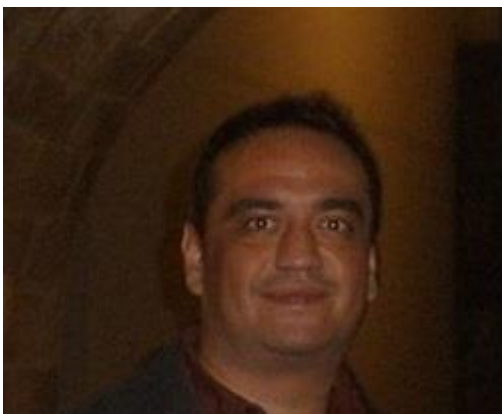
Ένα άρθρο του Ηλία Σ. Τζιώρα