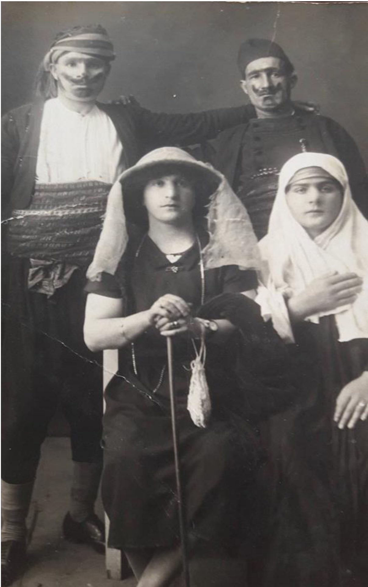
Εικόνα 8: 1 Μαρτίου 1925! Καρναβαλιστές στην Αλεξανδρούπολη!