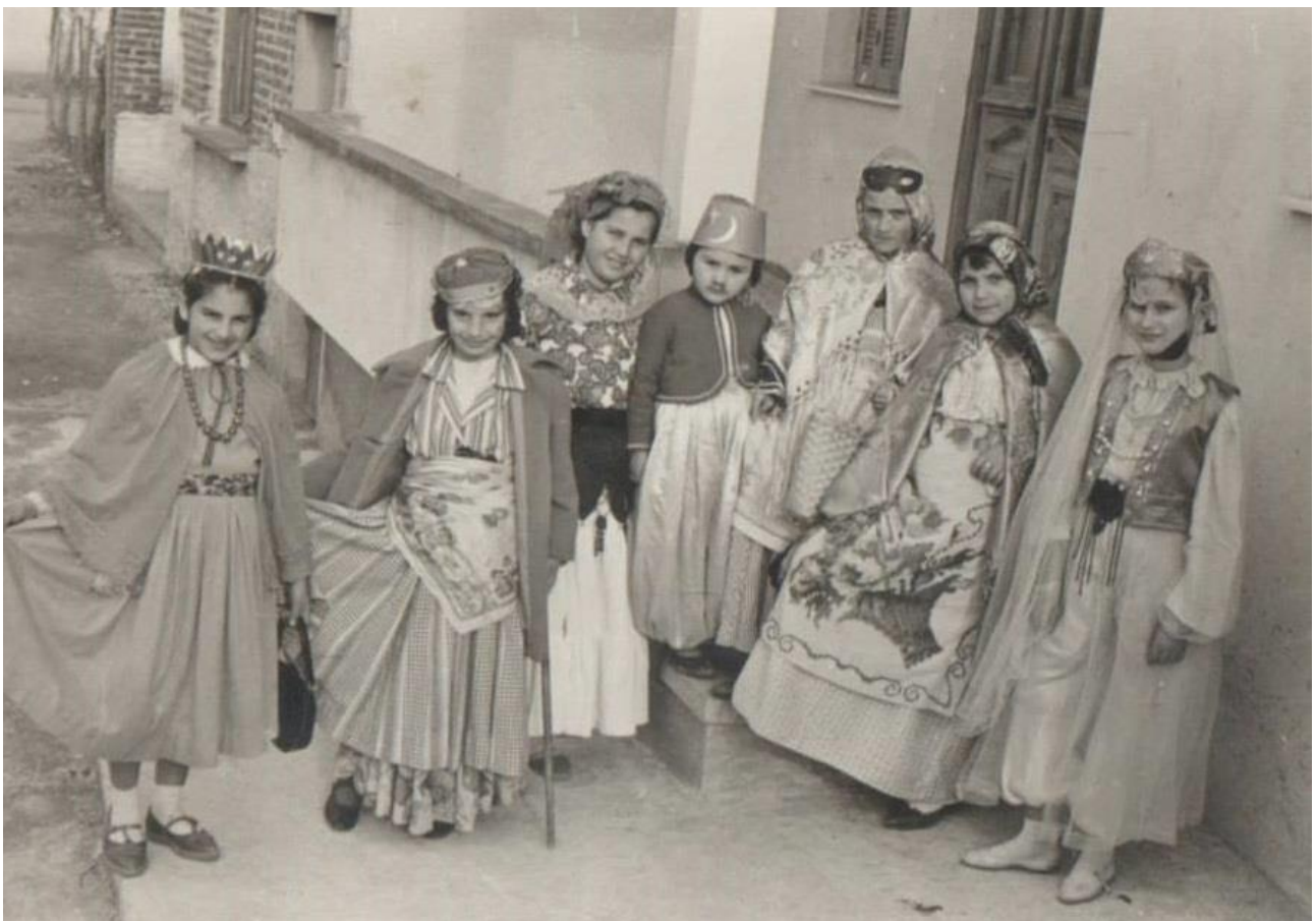
Εικόνα 27: Μάρτιος 1962, μικρές καρναβαλίστριες στην Αλεξανδρούπολη!