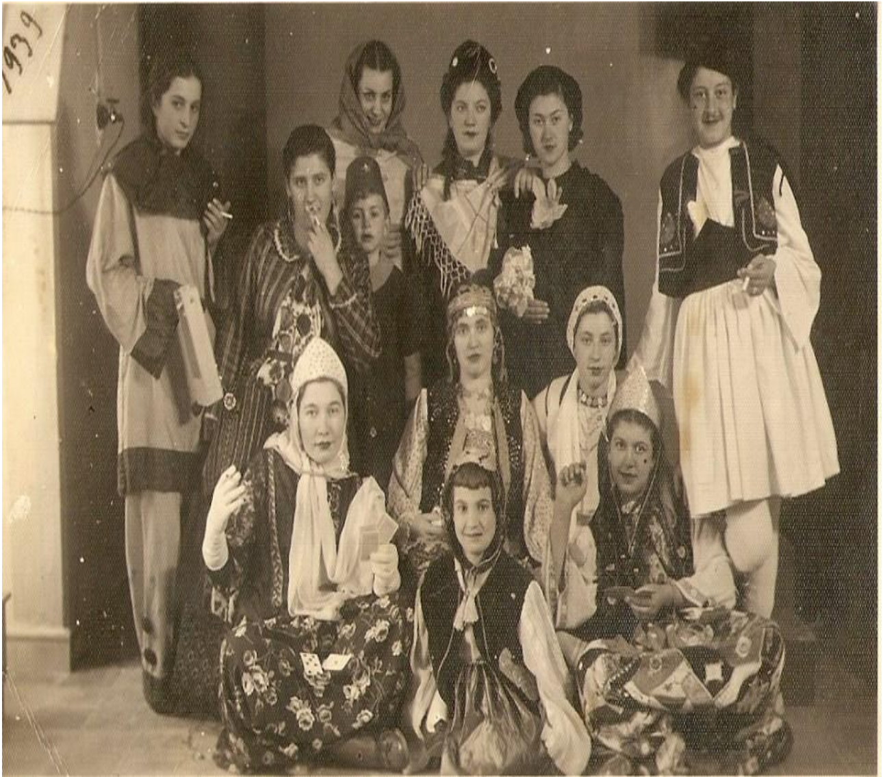
Εικόνα 10: 19 Φεβρουαρίου 1939! Καρναβάλια στη Παλαγία Αλεξανδρούπολης!