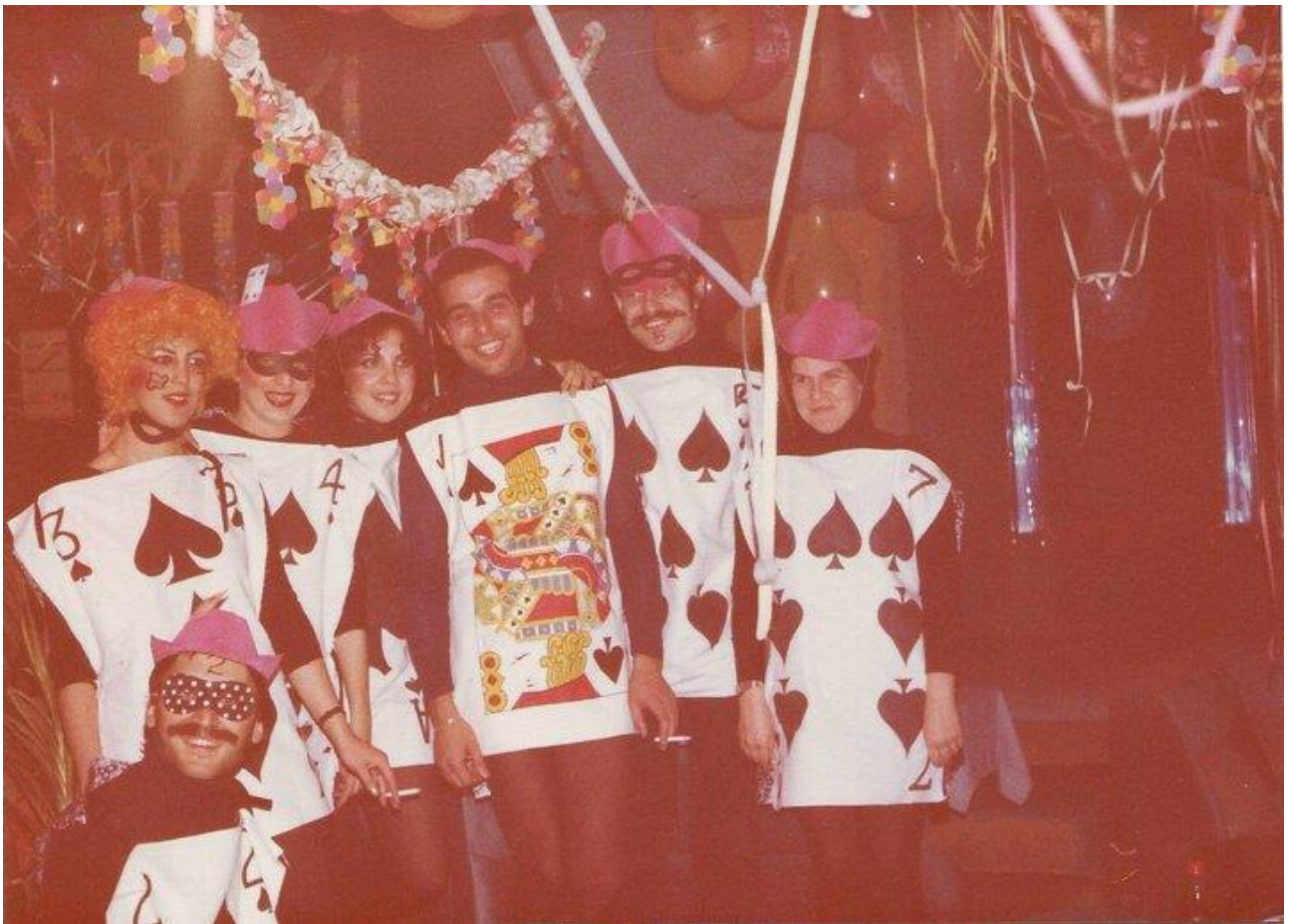
Εικόνα 38: 1983 Αποκριάτικο πάρτυ στη Disco MIRROR της Αλεξανδρούπολης!