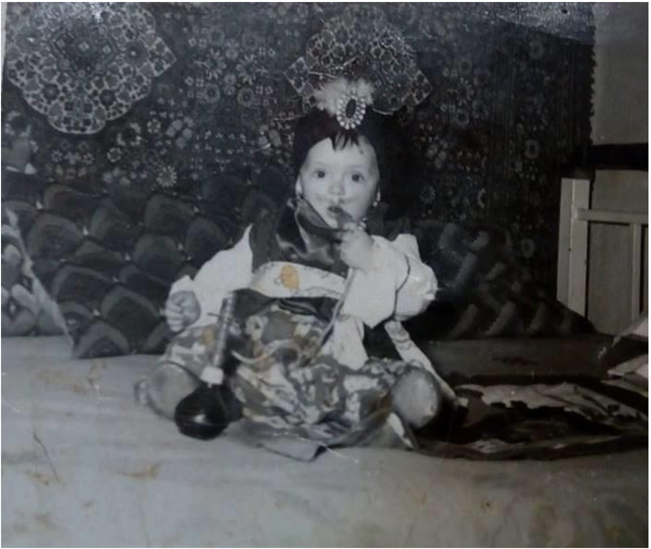
Εικόνα 14: 3 Μαρτίου 1957, στο "Φώτο ΡΙΟ" η 14 μηνών καρναβαλίστρια!