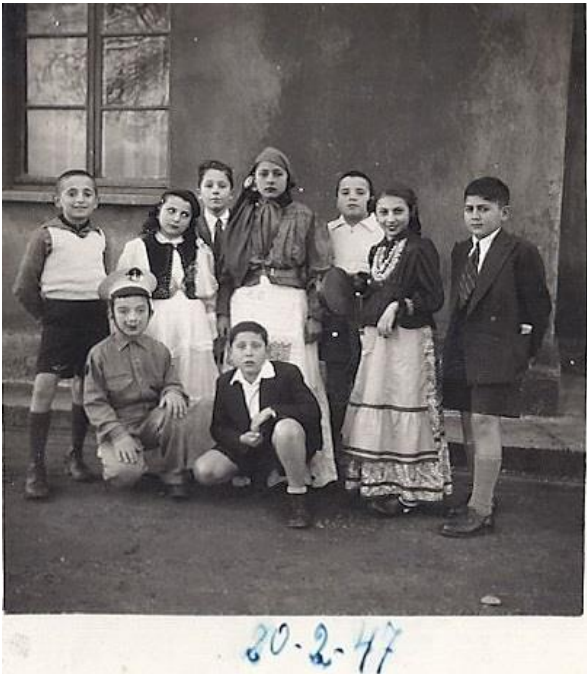
Εικόνα 11: 20 Φεβρουαρίου 1947, Απόκριες στην Αλεξανδρούπολη!

Επίσης την καθαρή Δευτέρα συναντούμε στο βόρειο Έβρο, σε χωριά όπως το Τρίγωνο ή η Ελιά, το έθιμο του «Μπέη» . Ένας άρχοντας, ο «Μπέης» με τους ακολούθους του, περιέρχεται τα σπίτια του χωριού, όπου δέχεται κέρασματα και δίνει ευχές. Ακολουθεί στην πλατεία, αναπαράσταση οργώματος, σποράς και γενετήσιας πράξης. Η άνοιξη της φύσης.