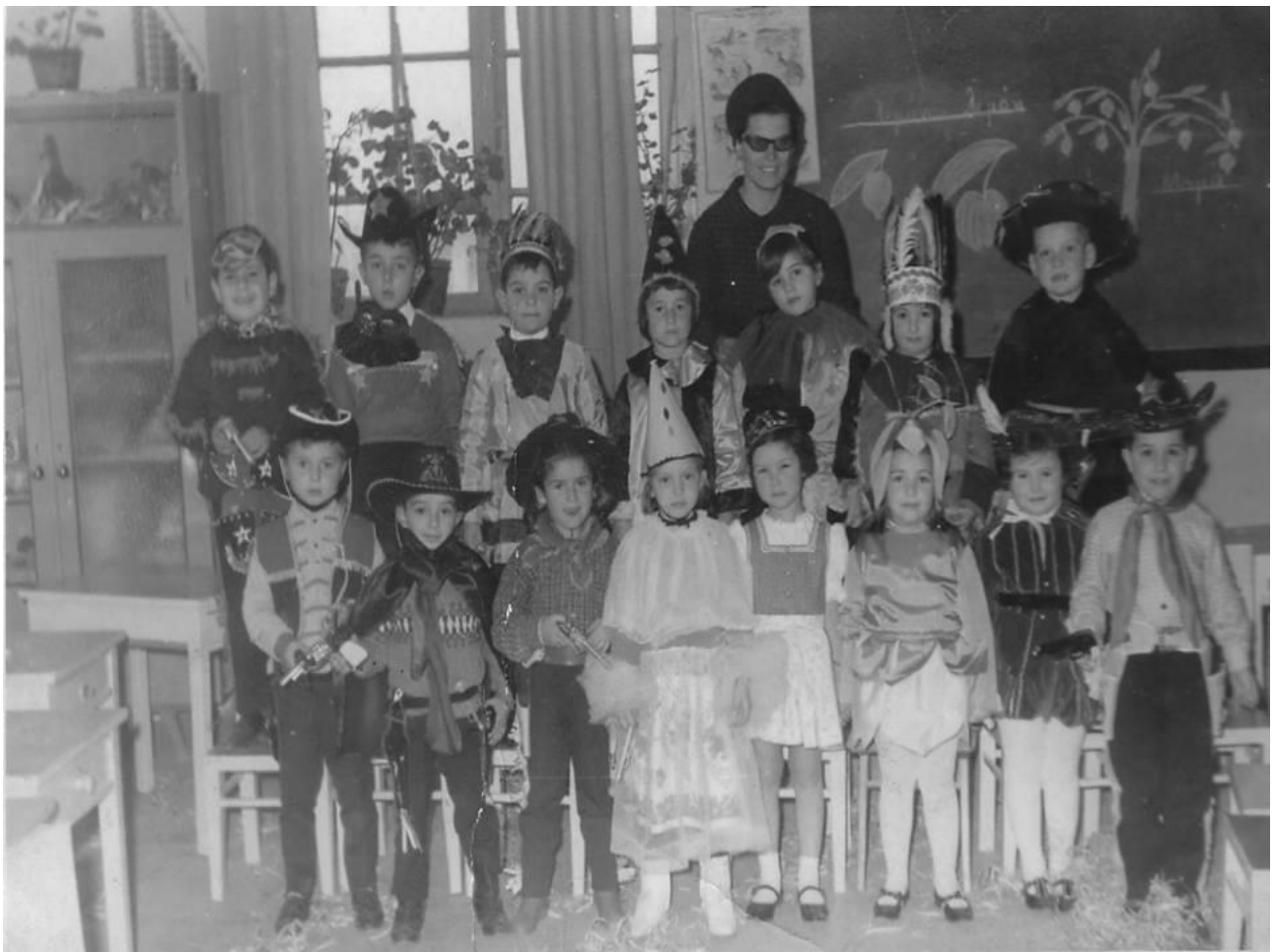
Εικόνα 31: 1968 στο 1ο Δημοτικό Σχολείο Αλεξανδρούπολης!