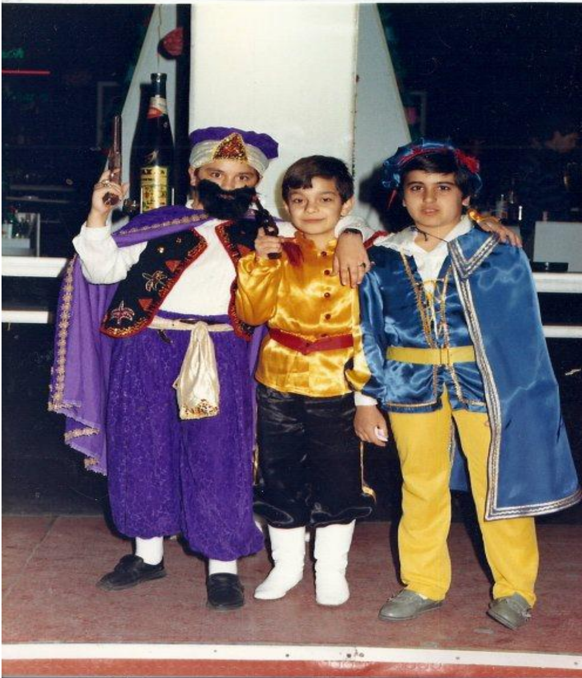
Εικόνα 40: 1988 - Σχολικό Μασκέ Πάρτυ του 3ου Δημοτικού Σχολείου στην Disco "ΑΣΤΡΟΝ" στο κέντρο της Αλεξανδρούπολης