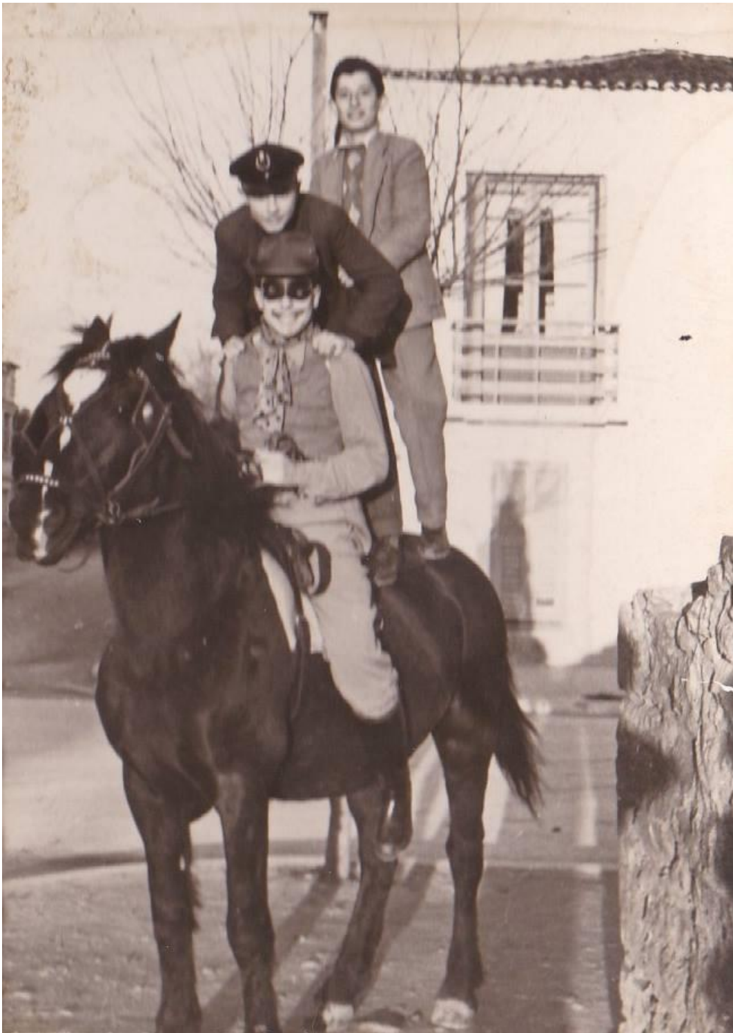
Εικόνα 15: 1958! Καρναβαλιστές πιτσιρικάδες πάνω στο άλογο στην Αλεξανδρούπολη!