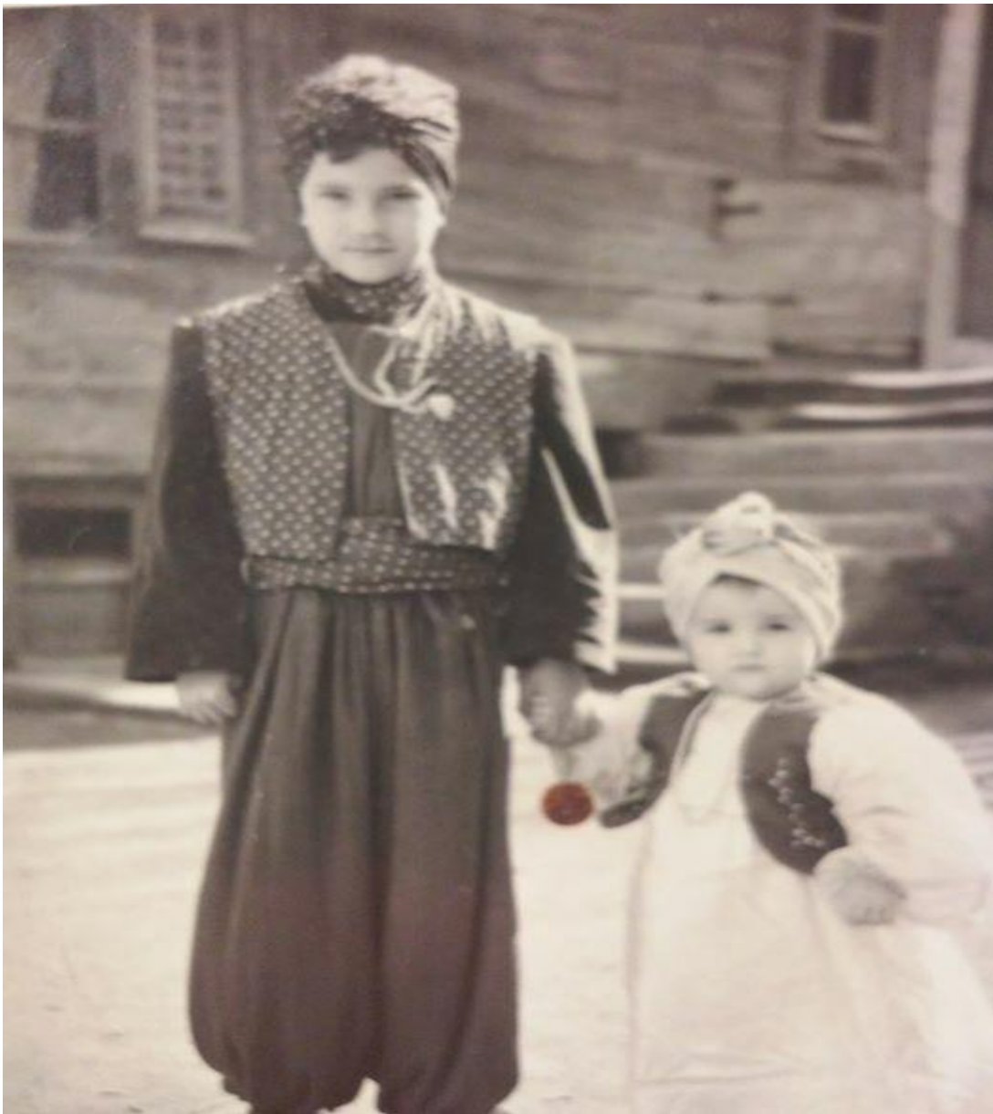
Εικόνα 12: 1947, Απόκριες στην Αλεξανδρούπολη!