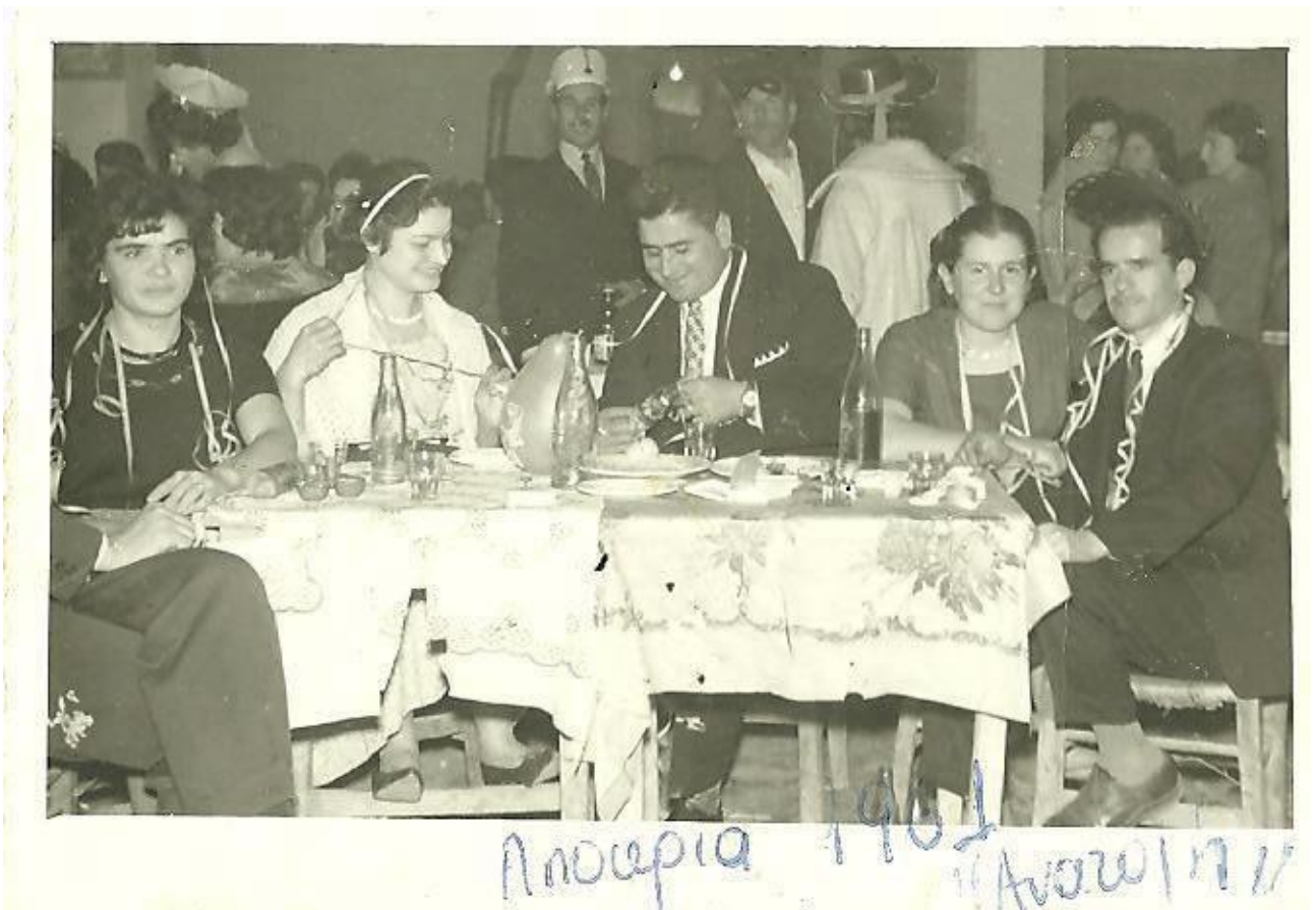
Εικόνα 21: ΑΠΟΚΡΙΕΣ 1961 στο κέντρο "ΑΝΑΤΟΛΗ".