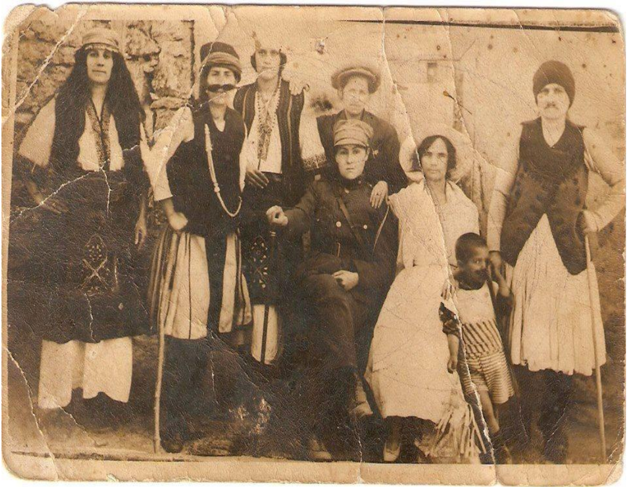
Εικόνα 6: 19 Μαρτίου 1925! «Αποκρηές στα Φέραι Έβρου» λείει από πίσω αυτή η φωτογραφία