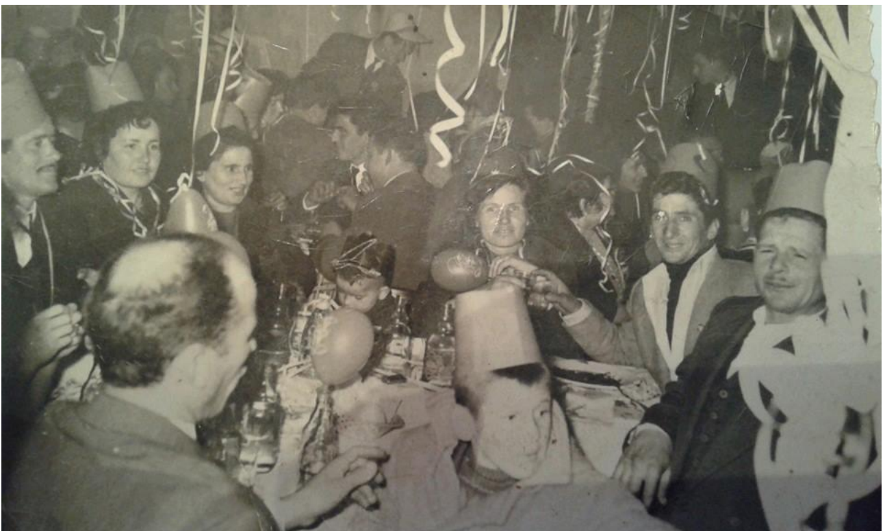
Εικόνα 29: 1963, Απόκριες σε ταβέρνα της Αλεξανδρούπολης