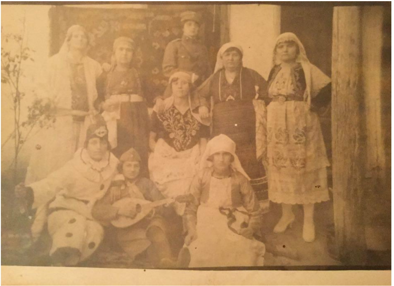
Εικόνα 2: 1916 Καρναβάλια στην Αλεξανδρούπολη ακριβώς ένα αιώνα πριν! Απεικονίζονται οι συνήθειες και ενδυμασίες που επέλεξαν για να γιορτάσουν αυτό το πανάρχαιο έθιμο στον Έβρο των αρχών του 20ου αιώνα.

Άλλωστε, οι αρχαίοι Θράκες ήταν εκστατικοί, καταλαμβάνονταν εύκολα από δέος και προπαντός ήταν γλεντζέδες, όπως οι σημερινοί Βαλκάνιοι.