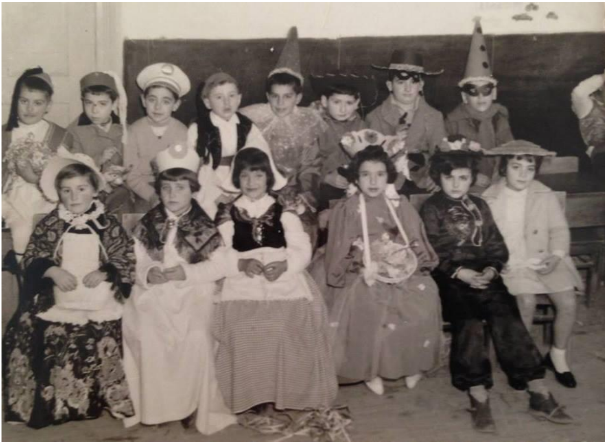
Εικόνα 26: 1962, Η Β΄ Τάξη του 3ου Δημοτικού Σχολείου Αλεξανδρούπολης γιορτάζει τις Απόκριες!