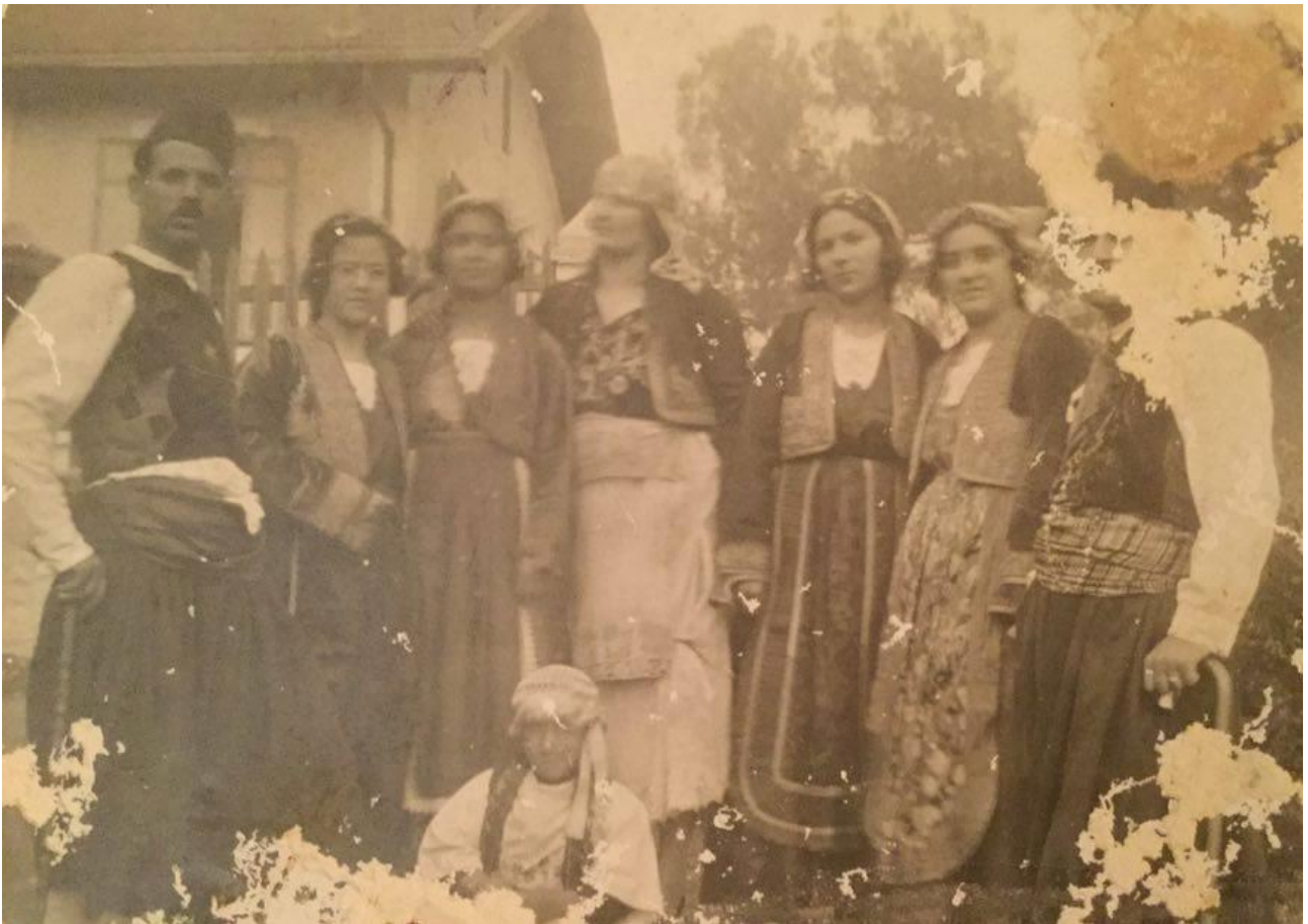
Εικόνα 3: 1916 Καρναβάλια στην Αλεξανδρούπολη ακριβώς ένα αιώνα πριν! Απεικονίζονται οι συνήθειες και ενδυμασίες που επέλεξαν για να γιορτάσουν αυτό το πανάρχαιο έθιμο στον Έβρο των αρχών του 20ου αιώνα.

Μπορεί οι Θράκες να πήραν πολλά πολιτιστικά στοιχεία από τη Νότια Ελλάδα, έδωσαν όμως σ' αυτήν κάτι πολύ σημαντικότερο: την Ορφική λατρεία και τη Διονυσιακή λατρεία από την οποία γεννήθηκαν η αρχαία μουσική , τα αρχαία μυστήρια όπως τα Ελευσίνια και τα Καβείρια της Σαμοθράκης όπου συμμετείχε και η μητέρα του Μέγα Αλέξανδρου, Ολυμπιάδα. Επίσης η αρχαία ποίηση και η ευφορία της οινοποσίας .