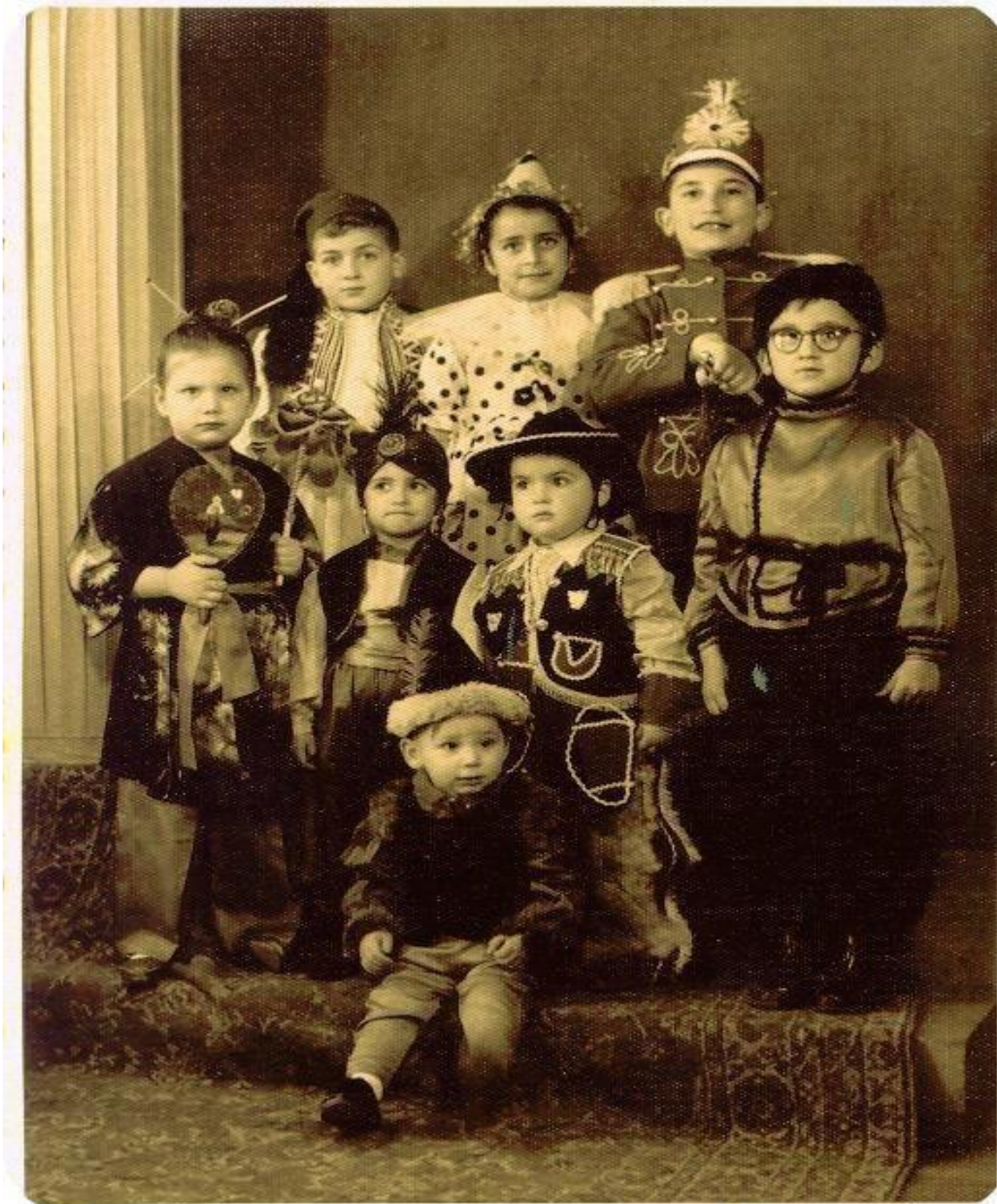
Εικόνα 17: 1959! Απόκριες στην Αλεξανδρούπολη!

Οι Εβρίτες όπως όλοι οι Έλληνες, αντάλλασαν επισκέψεις και διασκέδαζαν. Οι άνδρες ντύνονταν γυναίκες και οι γυναίκες μεταμφιέζονταν σε άντρες, έφτιαχναν τις συντροφίες τους και γύριζαν σε όλο το χωριό από σπίτι σε σπίτι. Αναπαρίσταναν γιατρούς με τα γιατροσόφια τους, γέρους και γριές με μπαστούνια και κουδούνια, αρκουδιάρηδες με κρεμασμένες κουδούνες στη μέση τους, για να γίνεται θόρυβος κ.α. Από νωρίς τα βράδια μαζεύονταν στις γειτονιές, στα ξέφωτα, στις πλατείες, όπου άναβαν φωτιές. Εκεί, μικροί και μεγάλοι χοροπηδώντας γύρω από τις φωτιές, τραγουδούσαν εύθυμα, έλεγαν πιπεράτα αστεία!