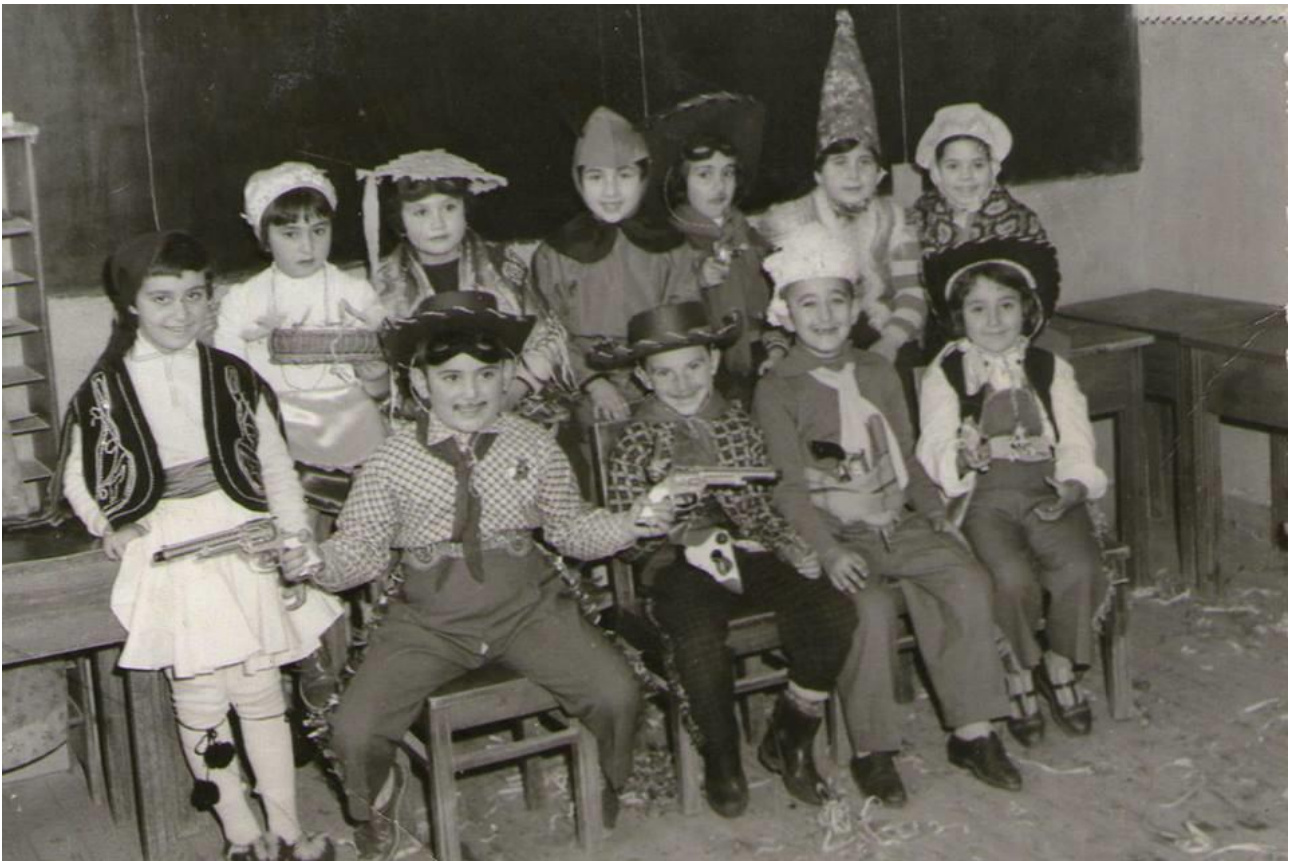
Εικόνα 22: 16 Φεβρουαρίου 1961! Στο 3ο Δημοτικό Σχολείο οι μικροί καρναβαλιστές, έτοιμοι για το σχολικό πάρτι!