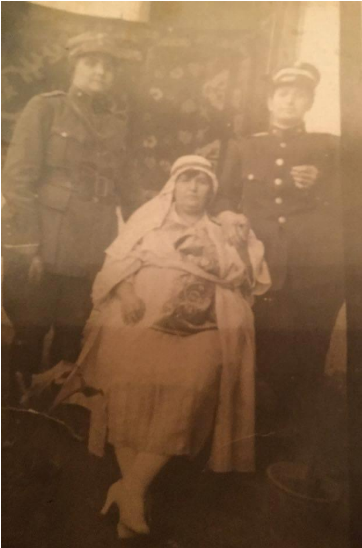
Εικόνα 5: 1916 Καρναβάλια στην Αλεξανδρούπολη ακριβώς ένα αιώνα πριν! Απεικονίζονται οι συνήθειες και ενδυμασίες που επέλεξαν για να γιορτάσουν αυτό το πανάρχαιο έθιμο στον Έβρο των αρχών του 20ου αιώνα.