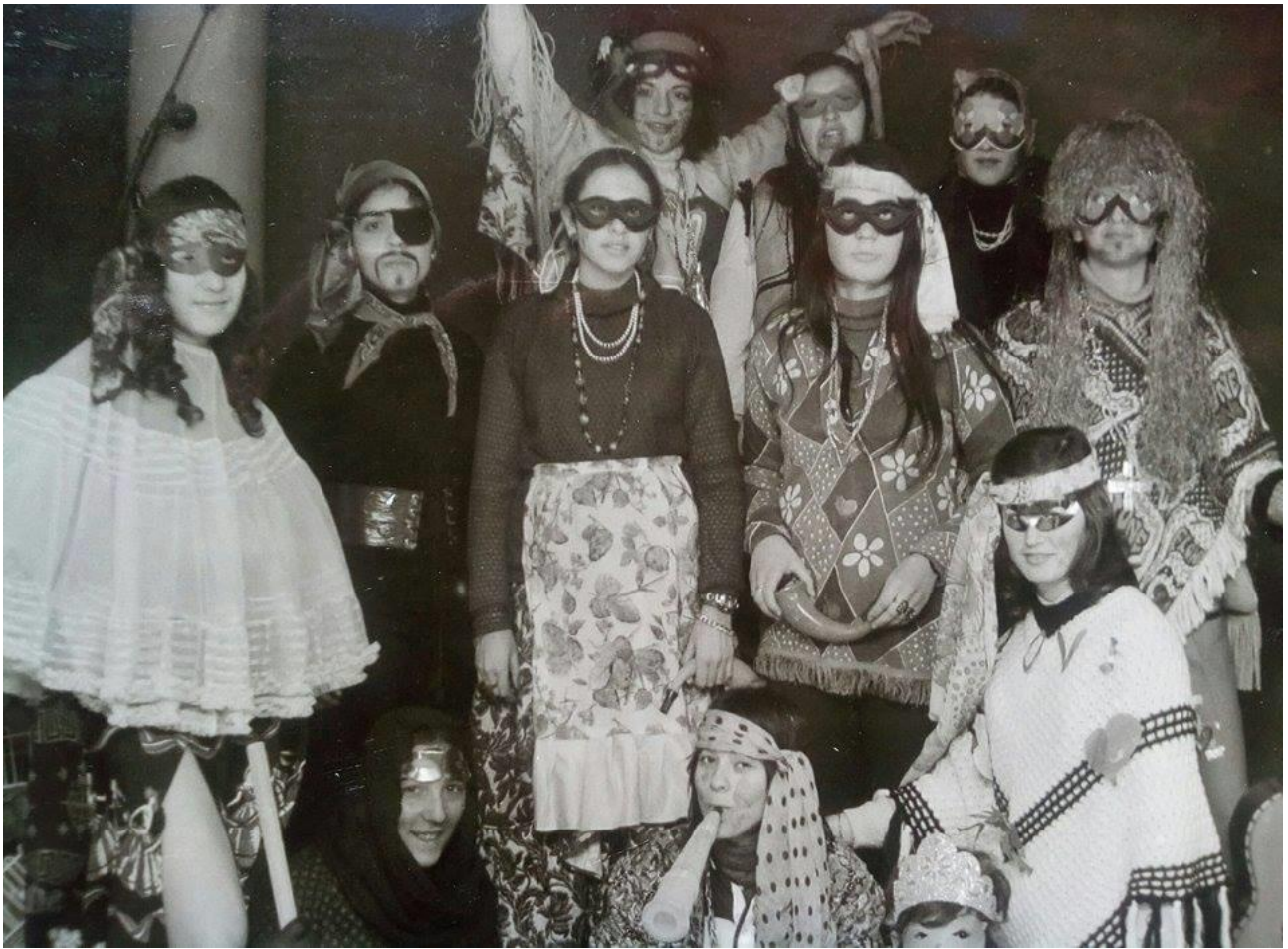
Εικόνα 37: 28 Φεβρουαρίου 1972 Καρναβαλίστριες στην Αλεξανδρούπολη