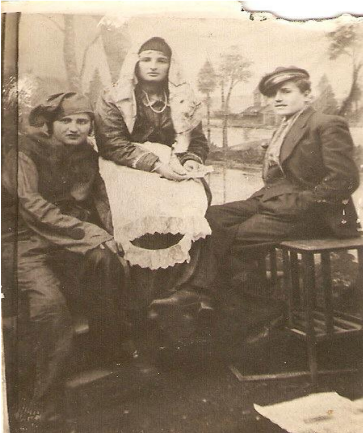
Εικόνα 9: 1936 Καρναβάλια στη Παλαγία Αλεξανδρούπολης

Αν και οι λαογράφοι αναγνωρίζουν σ' αυτό στοιχεία και αρχαιοελληνικά ακόμα, σύμφωνα με την παράδοση, το έθιμο της Καμήλας έχει τις ρίζες του στην Τουρκοκρατία. Ήταν τότε που Τούρκοι έκλεψαν την όμορφη Μανιώ και ο αγαπημένος της σκέφτηκε να κρυφτεί σε μια ψεύτικη καμήλα για να την πάρει πίσω. Έτσι κι έγινε, οι Τούρκοι χάζευαν την καμήλα κι ο νέος με τους φίλους του έσωσε το κορίτσι και το παντρεύτηκε.