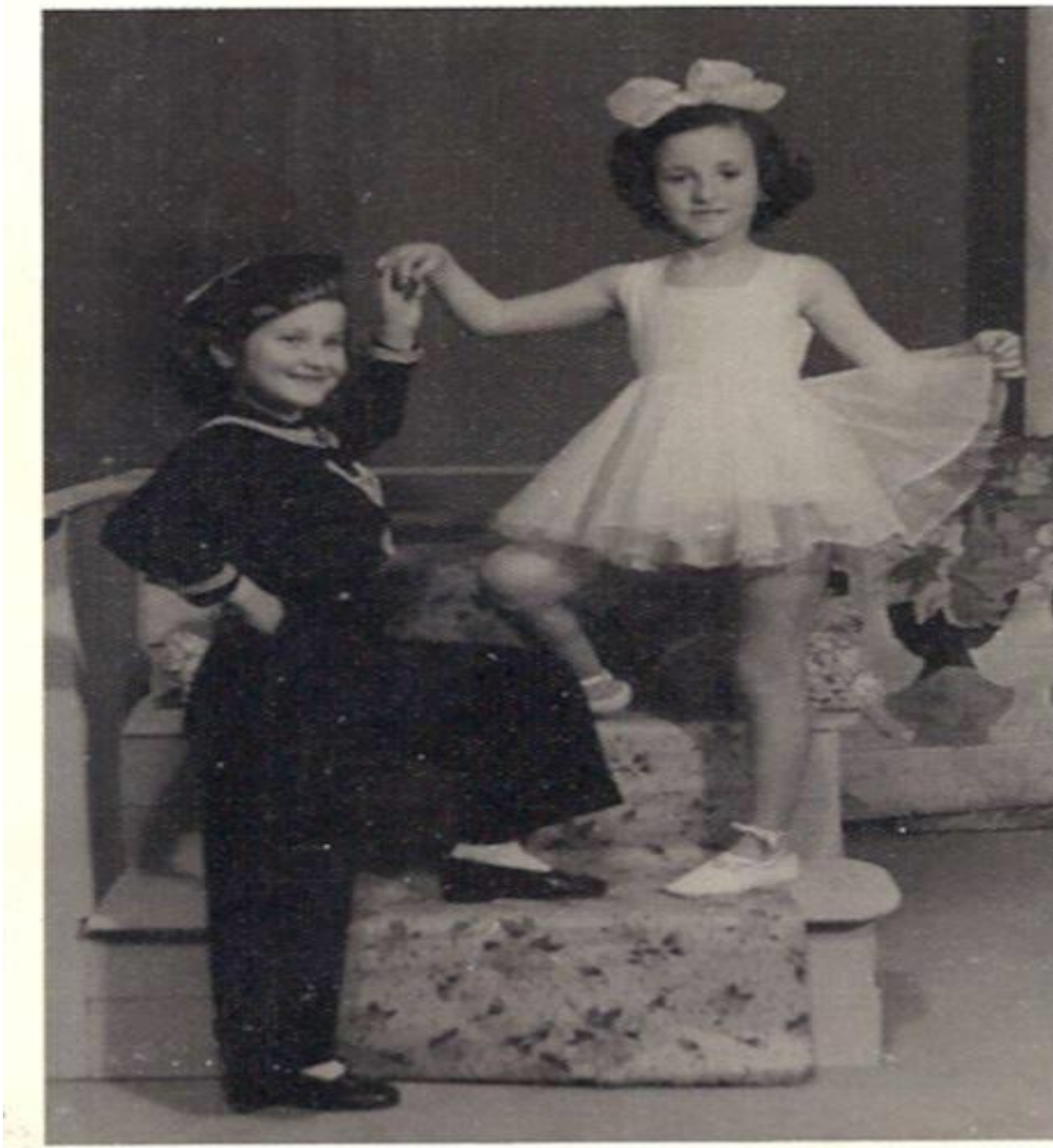
Εικόνα 13: 22 Φεβρουαρίου 1953, τα 8χρονα κοριτσάκια σε στούντιο της Αλεξανδρούπολης για φωτογραφία ΑΠΟΚΡΙΑΤΙΚΗ!