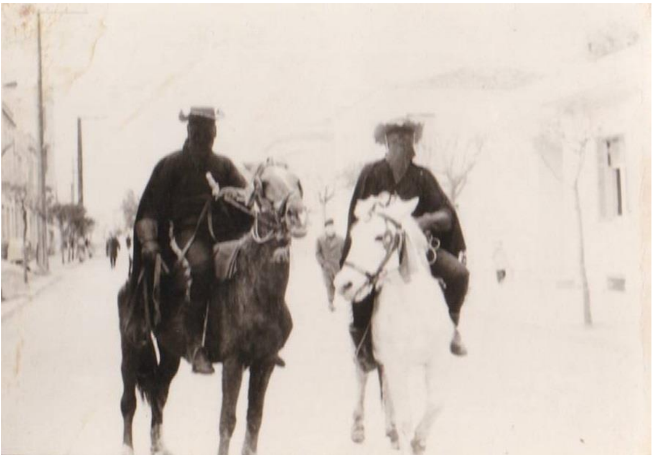
Εικόνα 23: Αποκριές 1962! Καρναβαλιστές Μασκοφόροι Εκδικητές πάνω στα άλογα στην Αλεξανδρούπολη!