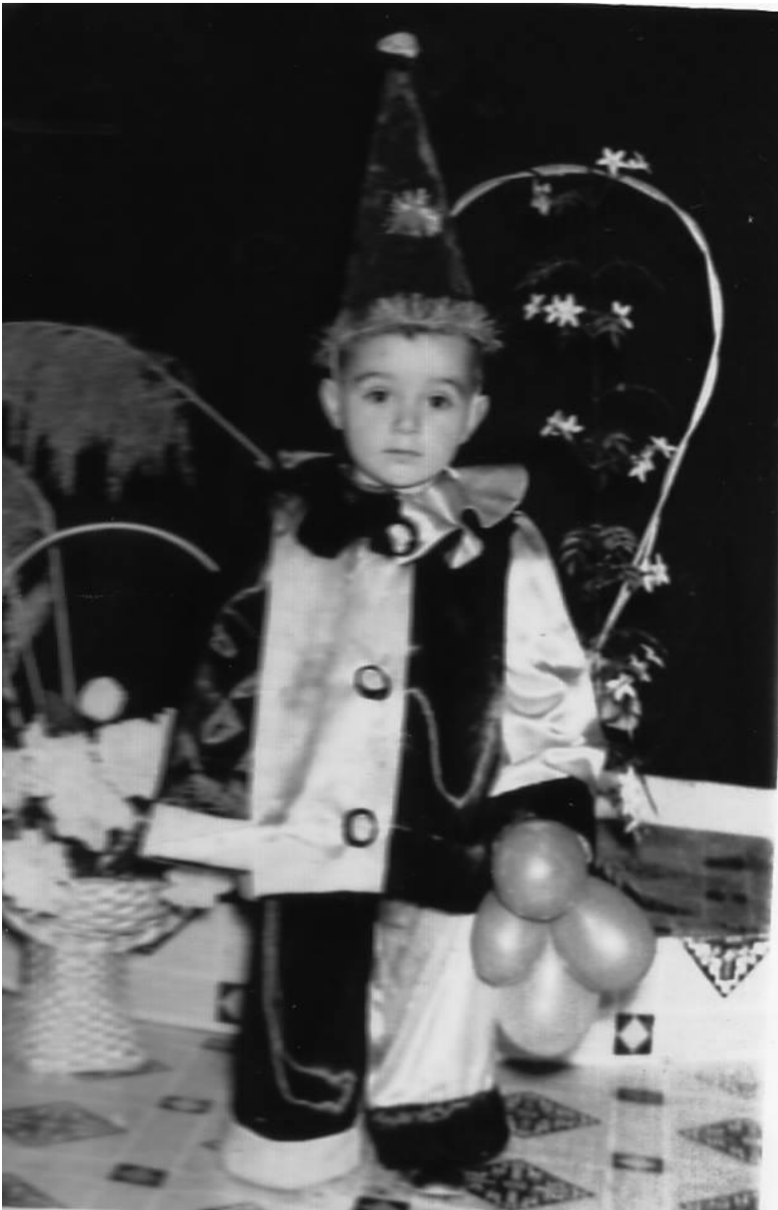
Εικόνα 32: 1965, ένας μικρός Πιερότος στην Αλεξανδρούπολη!