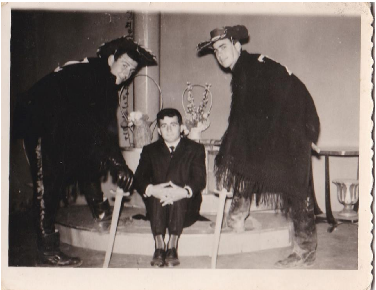
Εικόνα 25: Αποκριες 1962 στην Αλεξανδρούπολη! ΖΟΡΟ έτοιμοι για φωτογράφια!