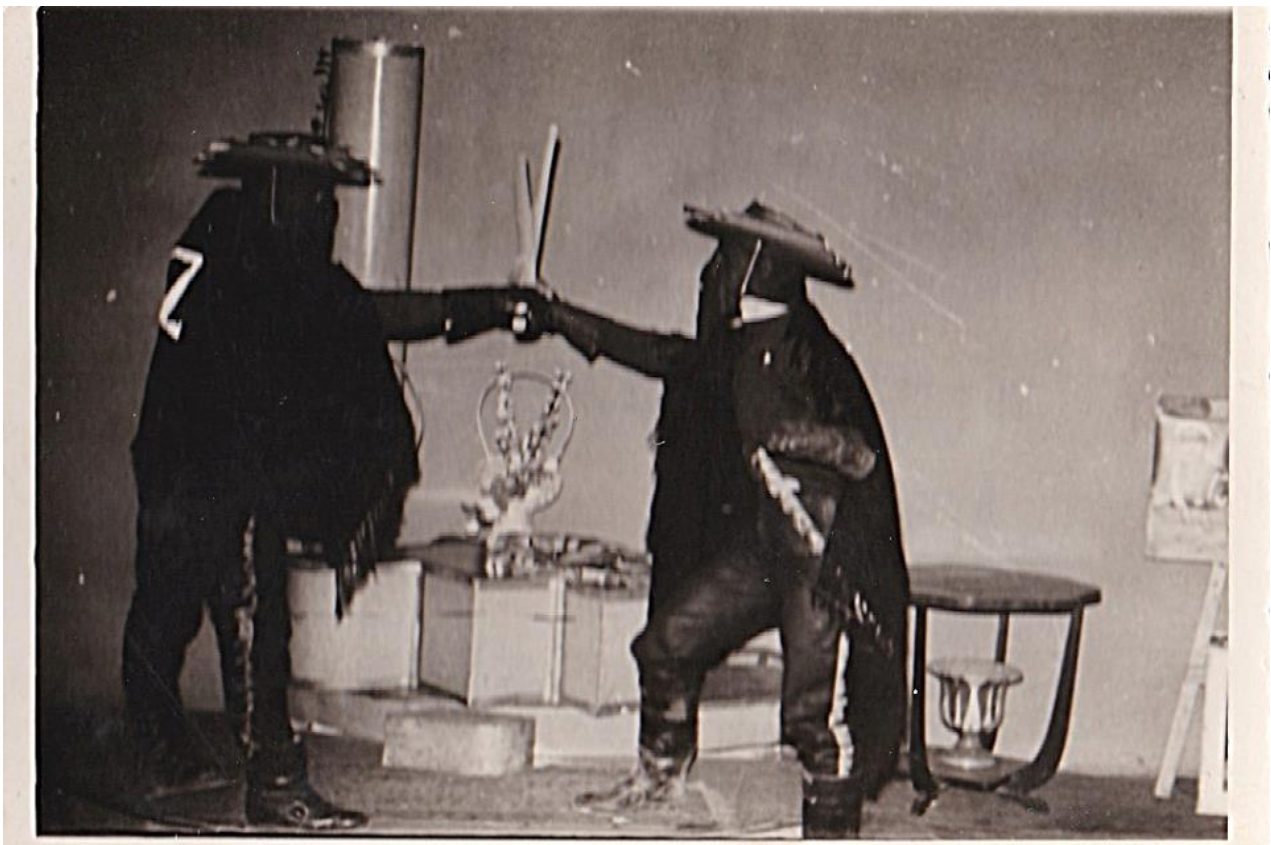
Εικόνα 24: Αποκριες 1962 στην Αλεξανδρούπολη! ΖΟΡΟμαχίες μέσα στο στούντιο!