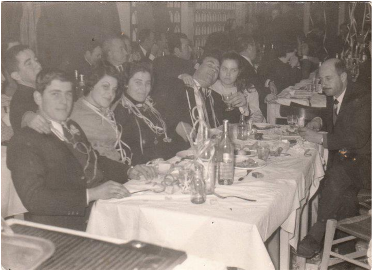
Εικόνα 30: 1965, Απόκριες στον Πλάτανο Μάκρης!