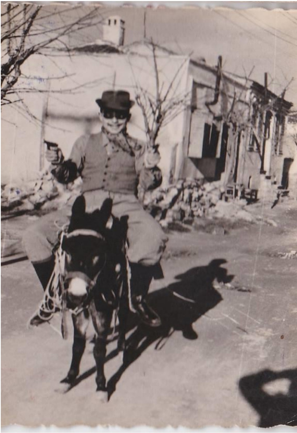
Εικόνα 16: 1958! Μασκαράς Cowboy πάνω στο γαϊδουράκι στην Αλεξανδρούπολη!