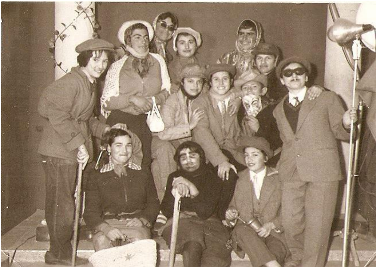
Εικόνα 20: Φεβρουάριος 1961, Καρναβαλιστές στην Απολλωνιάδα Αλεξανδρούπολης.