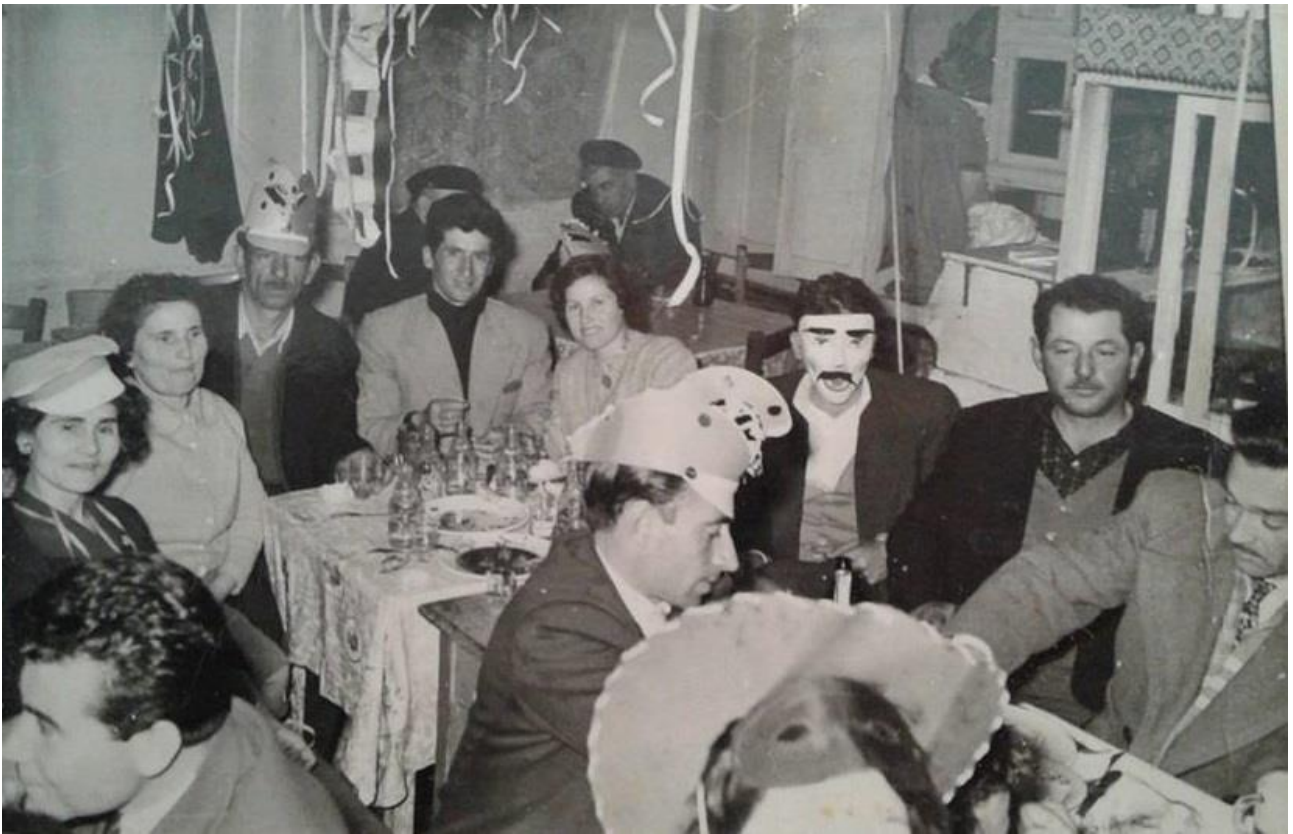
Εικόνα 28: 1963, Απόκριες σε ταβέρνα της Αλεξανδρούπολης